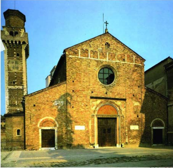
Prospetto della Basilica dei santi Felice e Fortunato